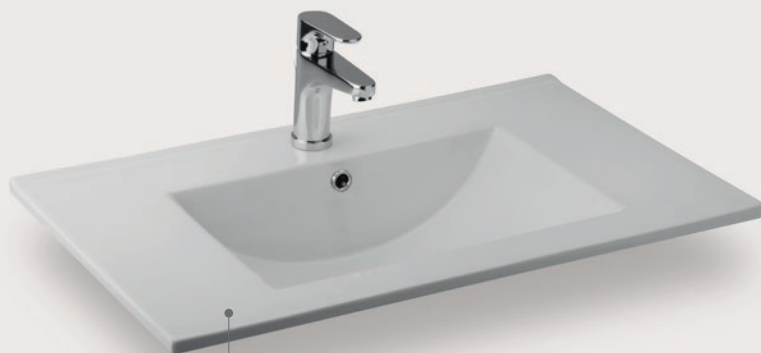
Lavabo Helena 75 cm