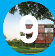
Casa binaria de madera

Desde el edificio se perciben espacial y visualmente dos entornos diferentes, uno urbano comercial y otro natural con el río y la vegetación. El enfoque funcional en planta libre tiene una resolución contemporánea contrastante. Entre planos negros la transparencia total permite visualizar el espacio y distinguir la fuerza de la combinación del negro y el turquesa respecto de los colores neutros del entorno, el acento de forma y color de la conexión vertical, los detalles y efectos de luz artificial.