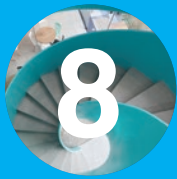
Patio de comidas La 24

Su emplazamiento entre los árboles logra la plena integración de los espacios interiores y exteriores. La conexión vertical aporta a la fluidez entre los espacios interiores siendo eje referencial y un acento por efecto de la luz. Aberturas y transparencias contribuyen a la prolongación física y visual al paisaje. Con un trazado modular y construcción rápida la estructura metálica y límites dan la sensación de liviandad y continuidad espacial hacia espacios exteriores diversos y conectados.