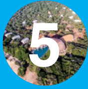
Wild Coast Tented Lodge

Integra agrupamientos de arquitectura orgánica a la naturaleza de bosques y costa escarpada. Con escala humana recrea macro y micro formaciones naturales. Se basa en participación comunitaria, tradiciones y materiales vernaculares, y en la luz, el agua y el arte. Minimiza el impacto ambiental con un enfoque local sostenible, energético y de reciclaje. Combina riqueza de sistemas constructivos, texturas y percepciones, en la solidez de grandes formas abovedadas y la liviandad de las estructuras.