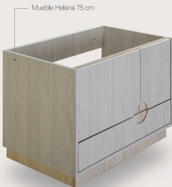
Mueble Helena 75 cm