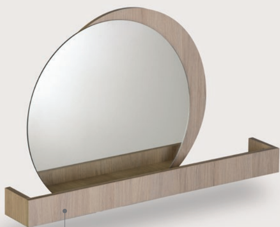
Espejo Helena 80 x 53 cm